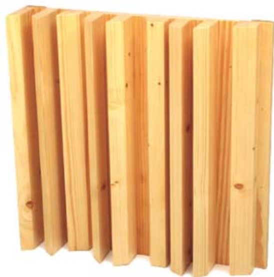
Acabamentos em madeira Mutene Teca Ebano Pinho Carvalho

Este painel difusor de madeira é fruto de prolongado processo de concepção e análise e é uma das opções da JOCAVI® no que diz respeito a painéis difusores.